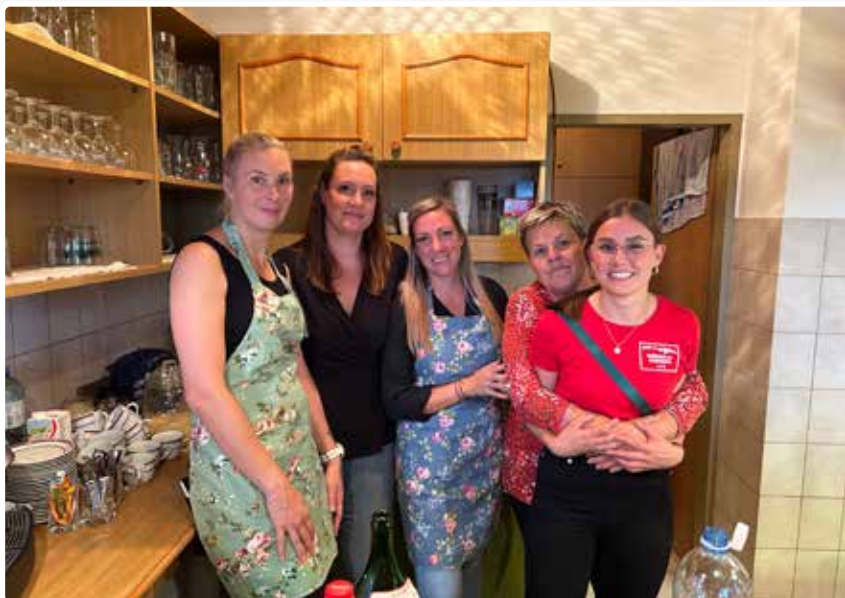
Herbstjause im Volksheim