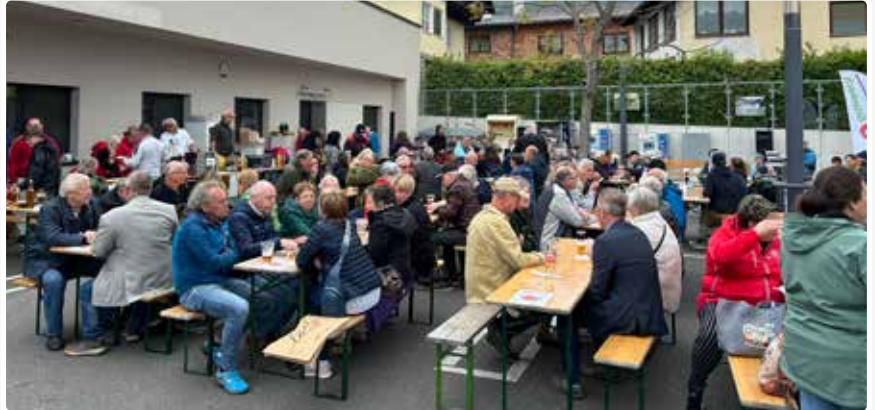
1. Mai 2024