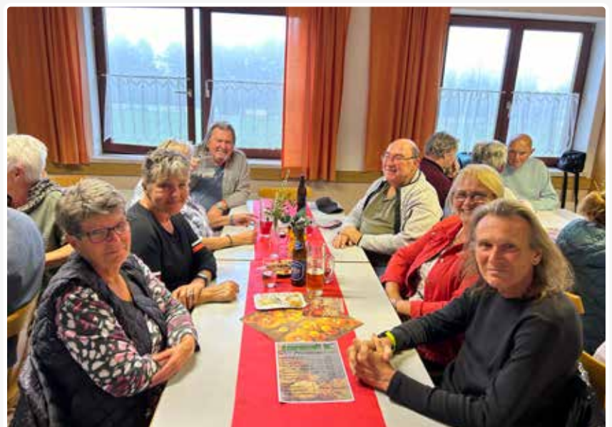
Herbstjause im Volksheim