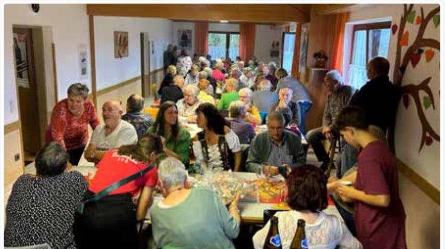
Herbstjause im Volksheim