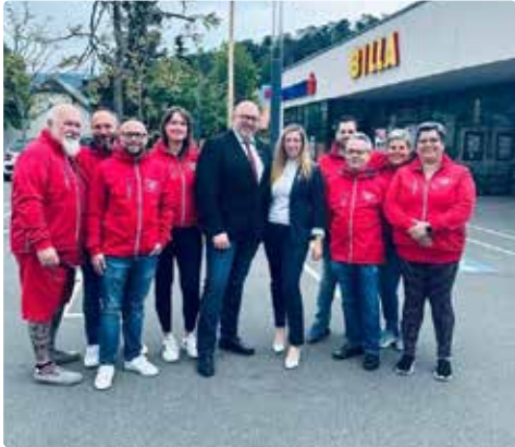
1. Mai 2024

Egal ob Geschichten von früher, neue Ideen für die Zukunft oder einfach ein Plauscherl über den Alltag - Nahe am Menschen lautet immer unsere Devise.