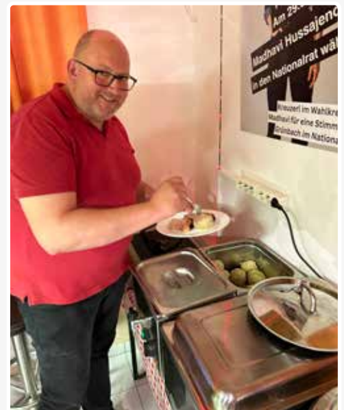
Herbstjause im Volksheim