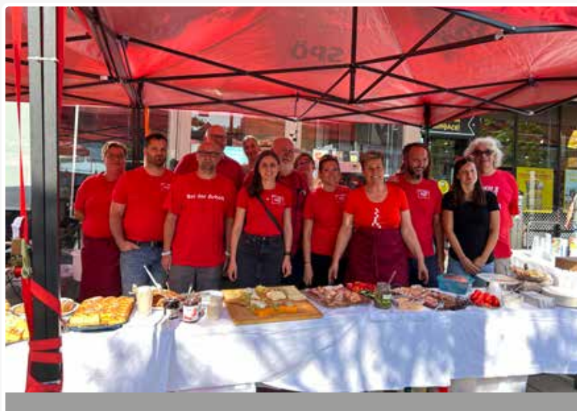
Sommerfrühstück am Hauptplatz