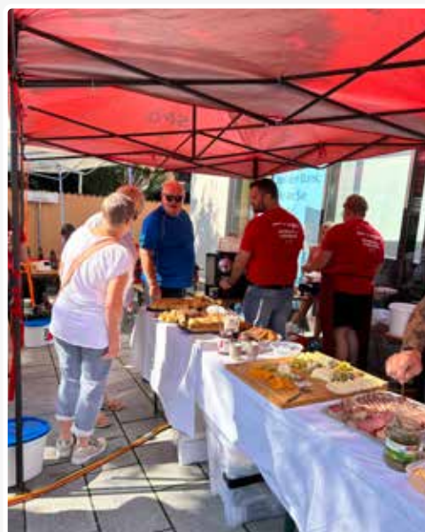
Sommerfrühstück am Hauptplatz