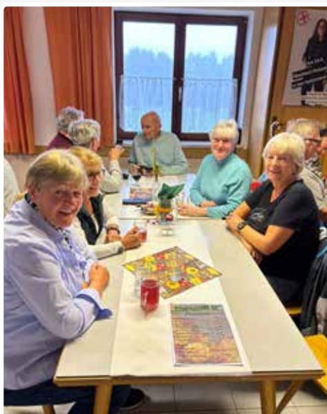
Herbstjause im Volksheim