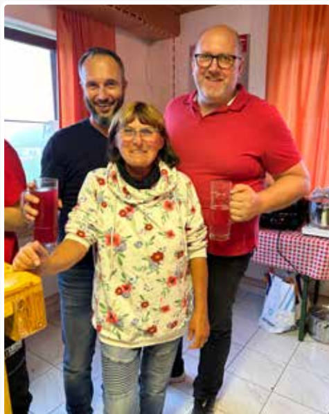
Herbstjause im Volksheim