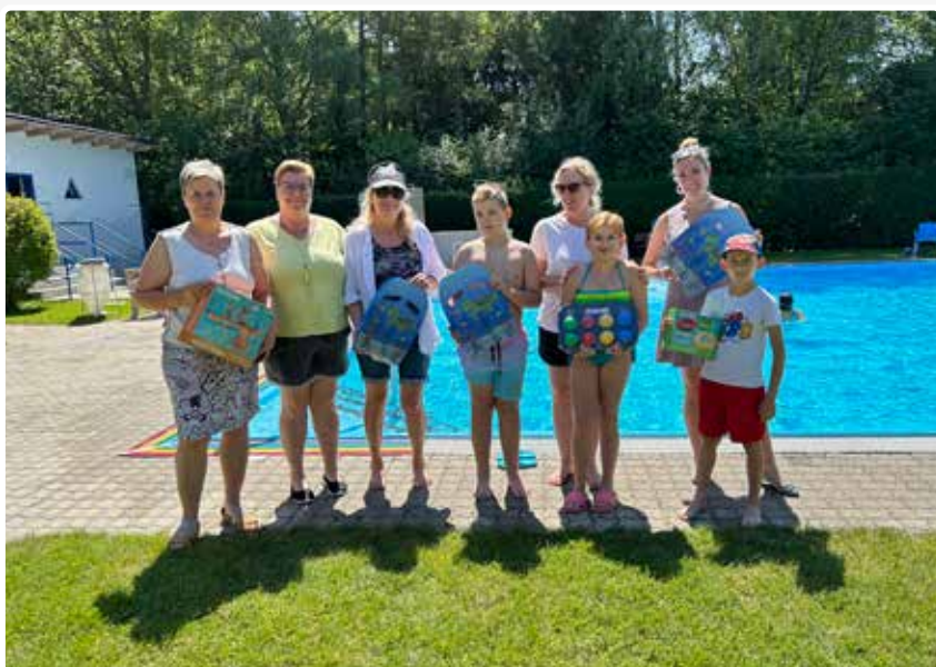
Spendenübergabe der Kinderfreunde für unser Schwimmbad